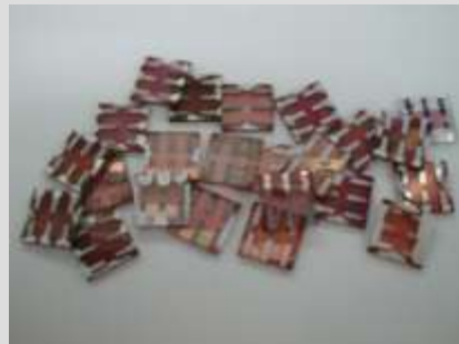
Dispositivos híbridos utilizando puntos cuánticos