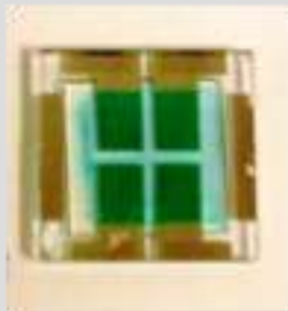
Dispositivos orgánicos utilizando polímeros semiconductores